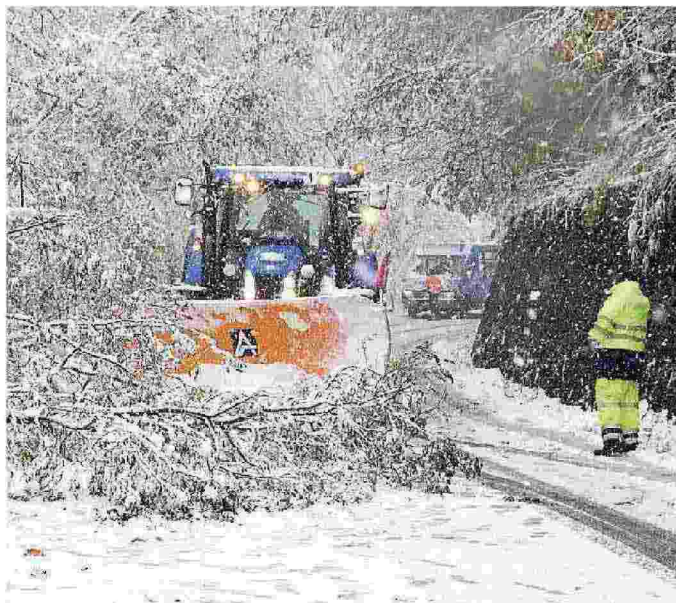
Spalaneve in azione durante la tormenta di ieri mattina