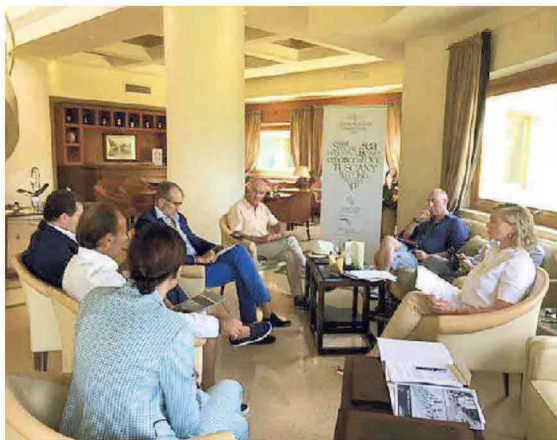
La conferenza stampa del gruppo Cosmopolitan Hotels al Tombolo

L'hotel Tombolo è nato nel 1998 su una struttura originaria degli anni Trenta, rilevata dalla famiglia Antinori. Là dove ora c'è un albergo di lusso e una spa, prima c'era infatti una colonia estiva costruita dalle Società elettriche del Nord su intuizione di Adriano Olivetti , l'industriale innovatore per antonomasia: centinaia di bambini figli di dipendenti hanno alloggiato in quelle stanze e preso il sole sulla spiaggia attigua.